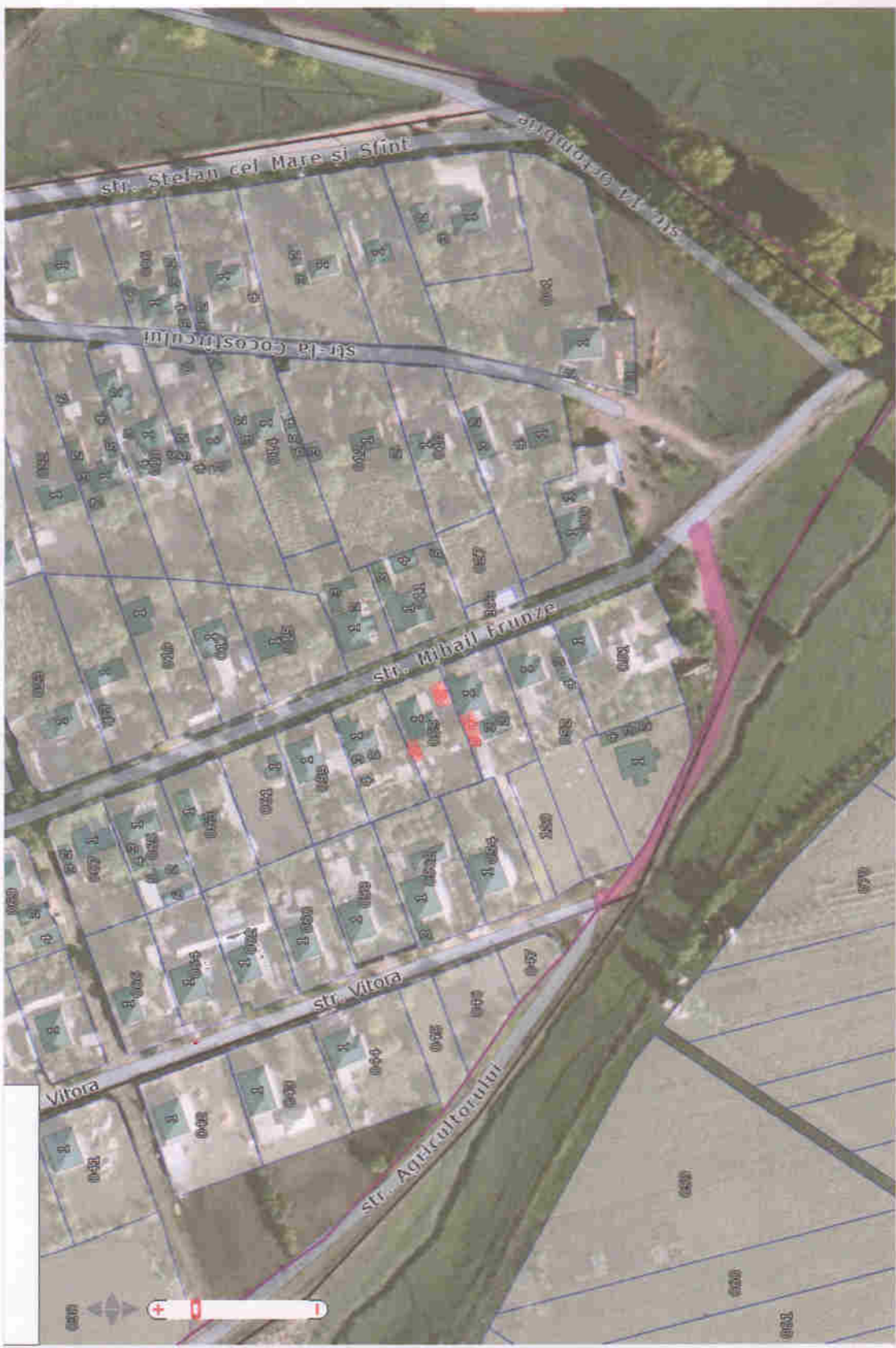
Scara 1:1000m 235749.77, 254371.40

Datele despre zonele valorice utilizate pentru evaluarea în scopul impozitării Datele din Registrul de stat al unităților administrativ-teritoriale și al adreselor.